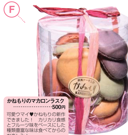
F かねもりのマカロンラスク .....500円

搾りたての牛乳を使って作られる14種のジェラート。ジェラート、ソフトクリーム各289円〜、ジェラート大福263円他。ギフト・地方発送も可。