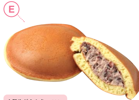
E 十勝生どらやき ...100円

無農薬有機栽培で作られたハスカップをふんだんに使用。ロールは甘酸っぱくモチモチの食感が味わえます。コンフィチュールは果肉と砂糖のみを使用。共にお土産にぴったりです！