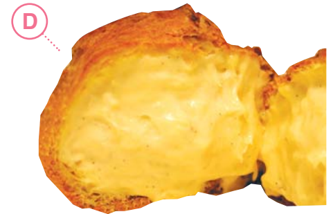
D スペシャル・パニーユ .....263円

可愛ウマイ♥かねもりの新作できました！カリカリ食感とフルーツ味をベースにした種類豊富な味は食べてからの楽しみ！