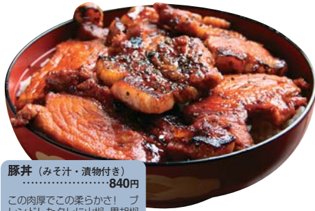
豚丼 (みそ汁・漬物付き) .....840円

この肉厚でこの柔らかさ！ プレンドしたタレに山椒・黒胡椒の香りが食欲を倍増させます。十勝産大豆の自家製味噌汁も絶品。ぜひ一度ご賞味あれ！