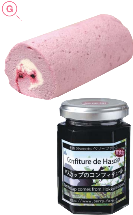
G (上) ハスカップロール .....1ロール 1,050円

アイスの原液を-40℃で急速冷凍した、つぶつぶ・まあるい魔法のアイス。今までにない不思議な食感が楽しめちゃう！低カロリーなのも嬉しいポイント。卵を使っていないのでアレルギーの方にもオススメです！