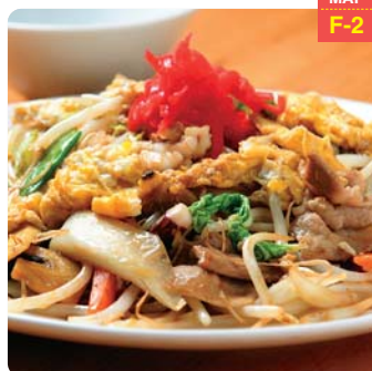
中華ちらし（スープ付き）…750円

ほか各種お持ち帰りメニューあり。 めん類（焼きそば含む）ご注文の方、 ライス無料&おかわり自由！