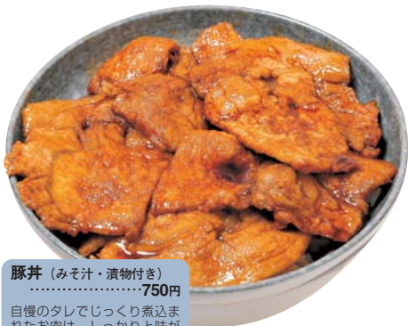
豚丼 (みそ汁・漬物付き) .....750円

自慢のタレでじっくり煮込まれたお肉は、しっかりと味が染み込んでとても柔らかい。「ラーメンを食べに来たのについつい...」という常連さんも。