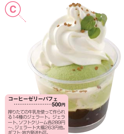
C コーヒーゼリーパフェ .....500円

十勝産の大豆を100%使用したつぶあん＆パニラ風味豊かなクリームをブレンドし、かつくらしした生地で包みました。レストランではお食事もできます。