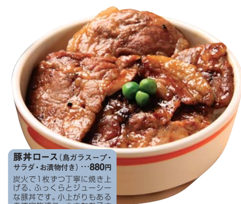
豚丼ロース (鳥ガラスープ・サラダ・お漬物付き) ...880円

自慢のタレでじっくり煮込まれたお肉は、しっかりと味が染み込んでとても柔らかい。「ラーメンを食べに来たのについつい...」という常連さんも。