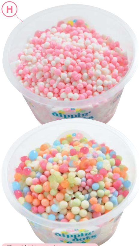
H ディップドッツアイス .....各種 320~380円

アイスの原液を-40℃で急速冷凍した、つぶつぶ・まあるい魔法のアイス。今までにない不思議な食感が楽しめちゃう！低カロリーなのも嬉しいポイント。卵を使っていないのでアレルギーの方にもオススメです！