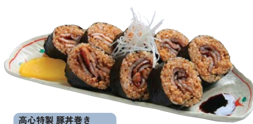
高心特製 豚丼巻き .....680円

この肉厚でこの柔らかさ！ プレンドしたタレに山椒・黒胡椒の香りが食欲を倍増させます。十勝産大豆の自家製味噌汁も絶品。ぜひ一度ご賞味あれ！