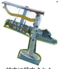
校内に設立された「すくすく農園」