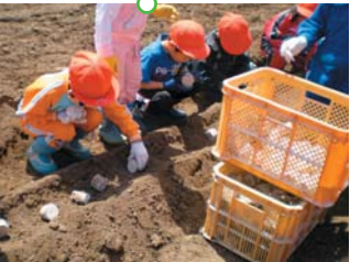
これから長いもを植えるよ! どんなお花が咲くのかな?