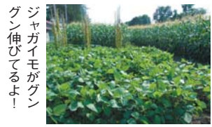
ジャガイモがグングン伸びてるよ!