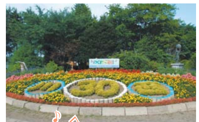
鮮やかな花たちで祝福! 30周年記念花壇。

学校と地域が密着して活動している川西町は、人の優しさと豊かな自然に溢れた町でした。雄大な自然に包まれてのびのびと育つ子どもたち。太陽の下でびっしり汗をかきながら元気に走りまわる姿は、見ているだけで笑顔になってしまうくらい微笑ましいものでした。