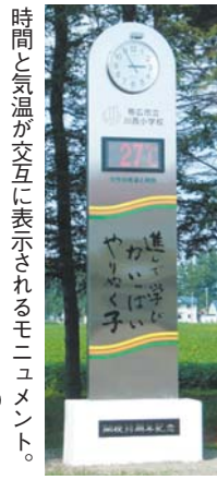
時間と気温が交互に表示されるモニユメント。